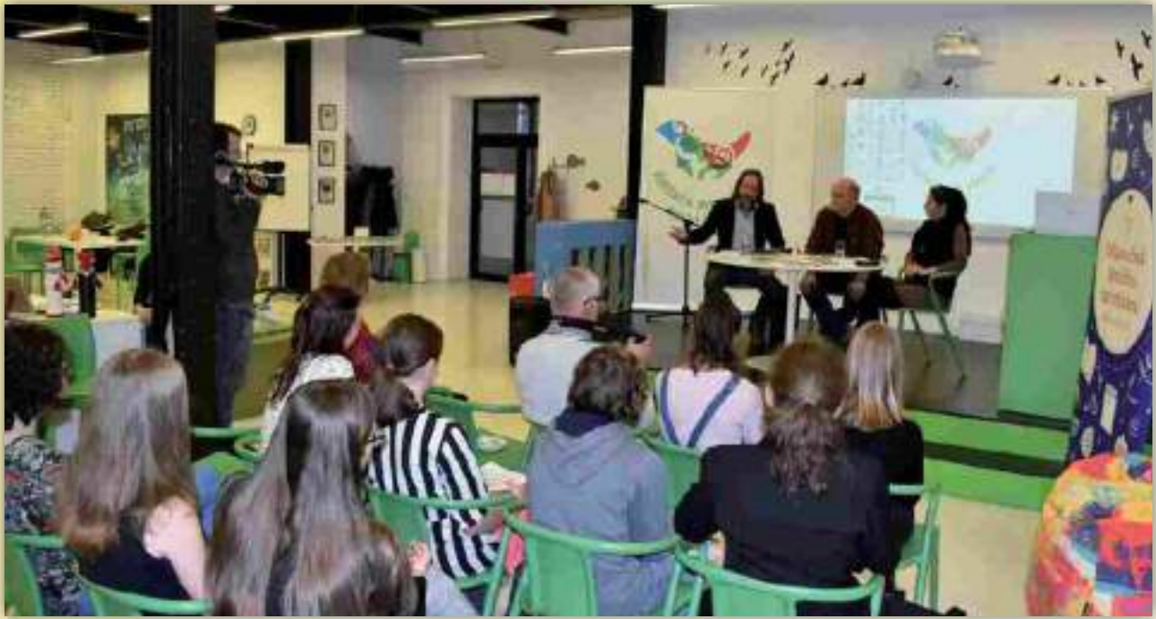
„Rozbor textov rozprávok prezentovaných autormi odbornou porotou“