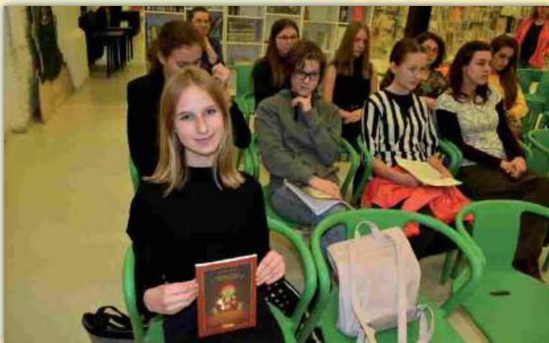
„Každý účastník festivalu / tvorivých dielní obdržal aj knižnú publikáciu od jednotlivých autorov s ich podpisom a venovaním“