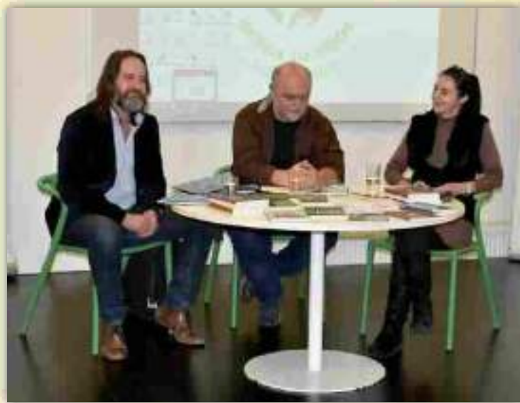
„Rozbor textov rozprávok prezentovaných autormi odbornou porotou“